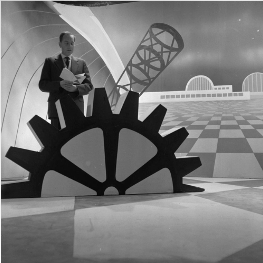
Image source: Collection Netherlands Institute for Sound and Vision. Set De Taal van de Machine (VPRO) d.d. 13 November 1958. License: Creative Commons Attribution-ShareAlike ( http://creativecommons.org/licenses/by-sa/3.0/nl/ ).