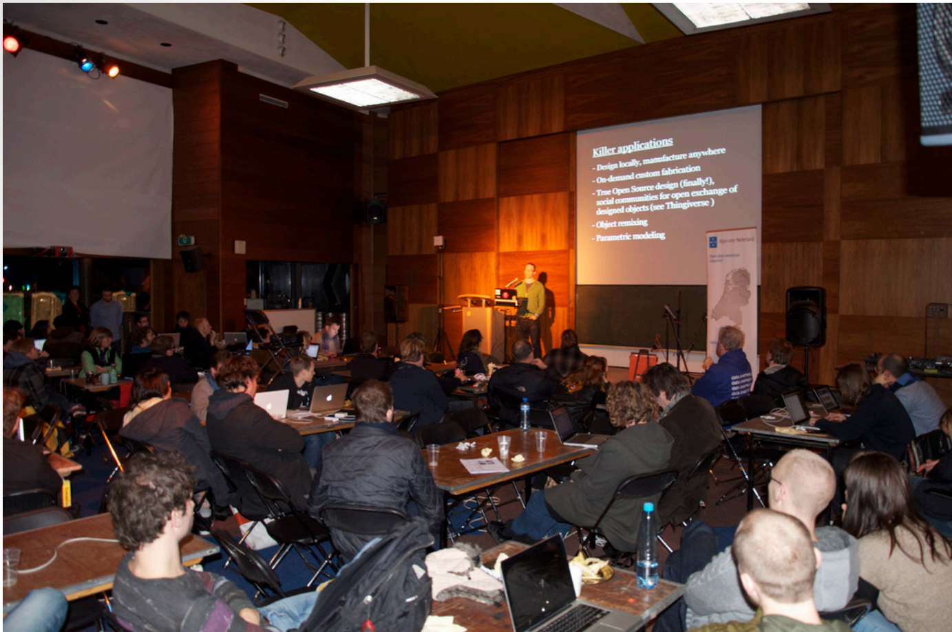
Photo: Breyten Ernsting. CC BY ( http://creativecommons.org/licenses/by/3.0/nl/ )